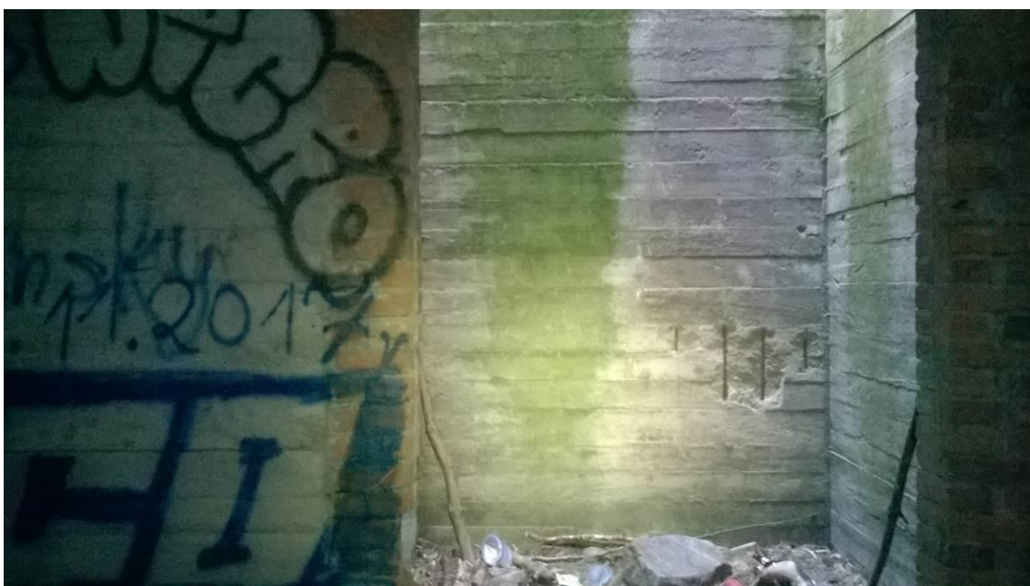
zdj. 9 – Widok na jeden z szybów z wyjściem na zewnątrz. [fot. opracowanie własne]