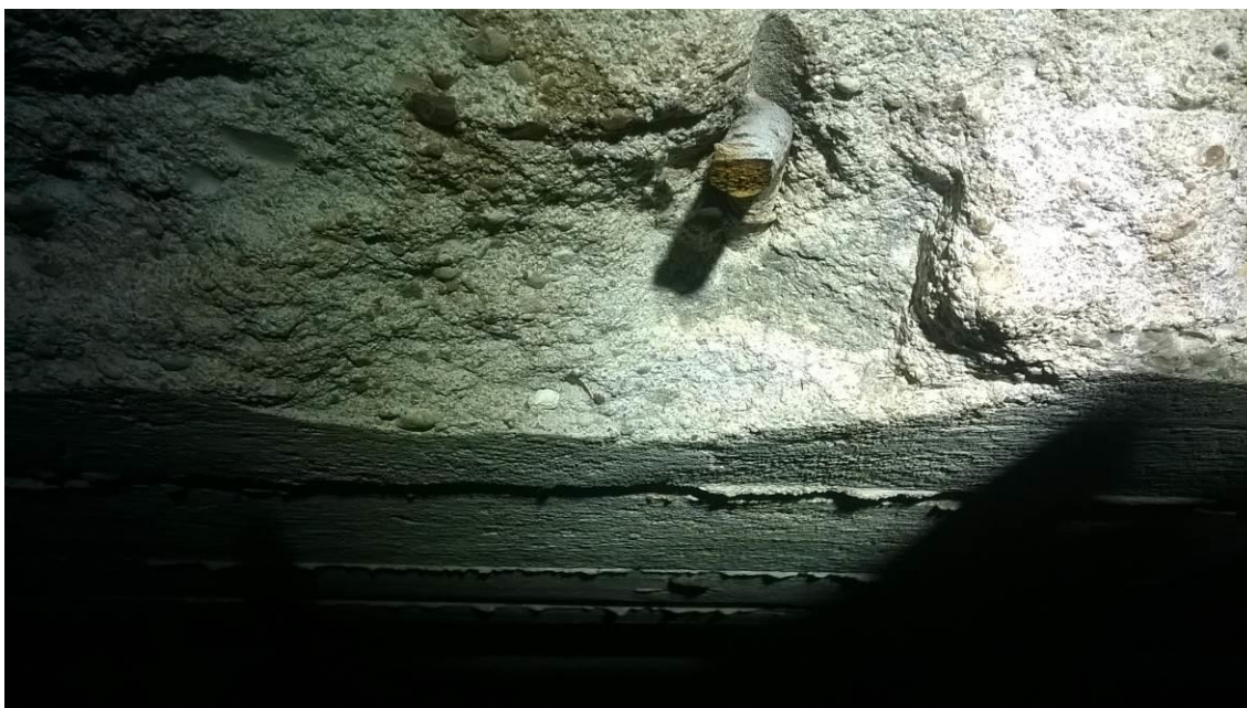
zdj. 8 – Pozostałości po zbrojeniu w otworze wentylacyjnym.