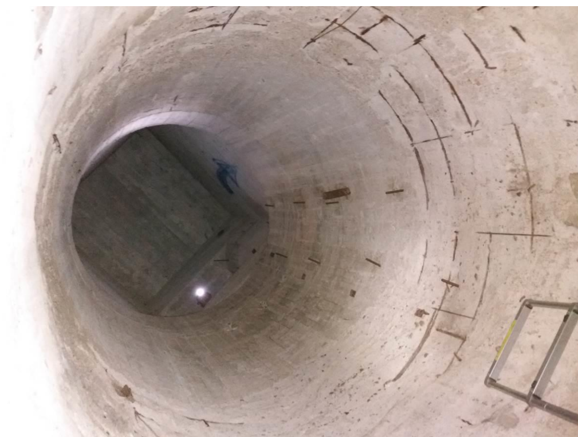
zdj. 3 – Widok na miejsce montażu kraty od strony szybu.