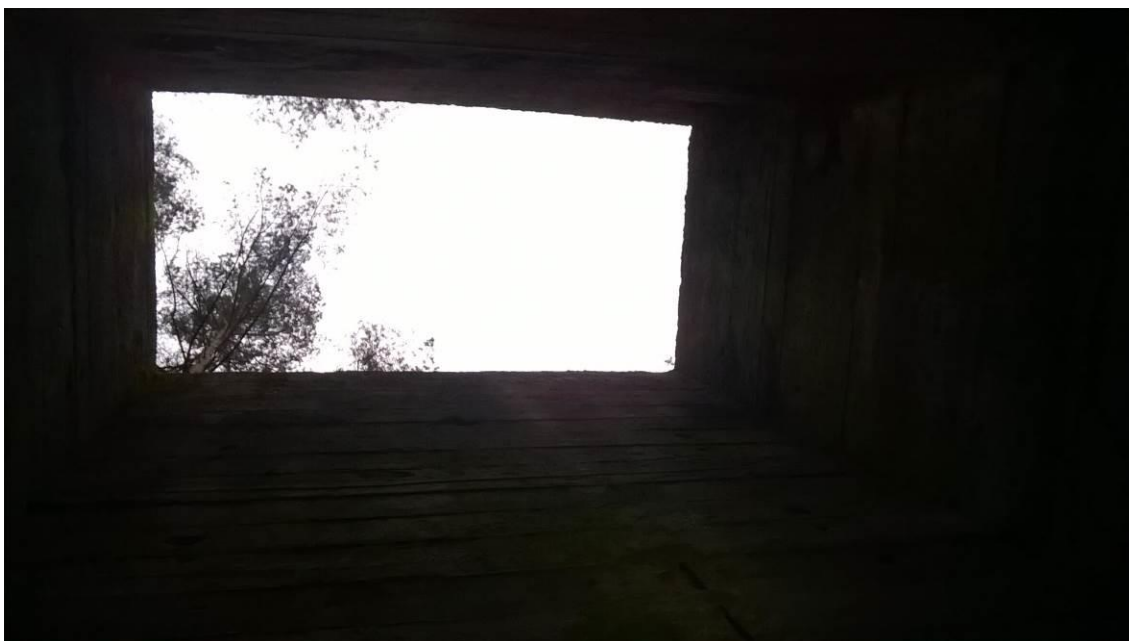
zdj. 6 – Widok na większy otwór wejściowy do komory przed szybem.