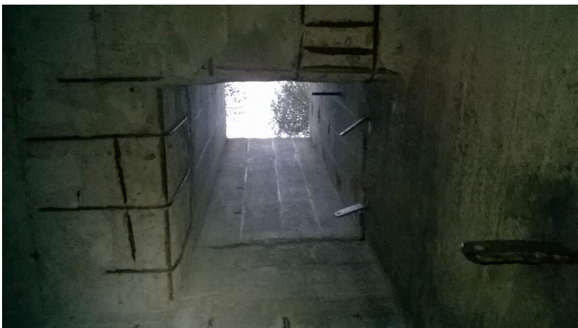
zdj. 7 – Widok na mniejszy otwór wejściowy do komory przed szybem