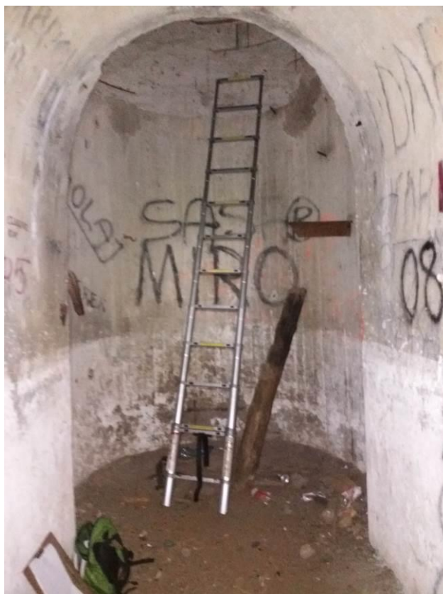
zdj. 4 – Wejście do szybu.