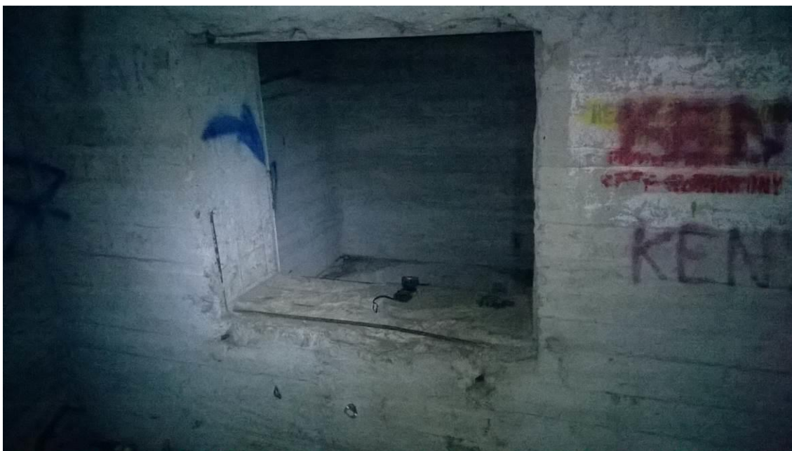
zdj. 2 – Widok na miejsce montażu kraty.