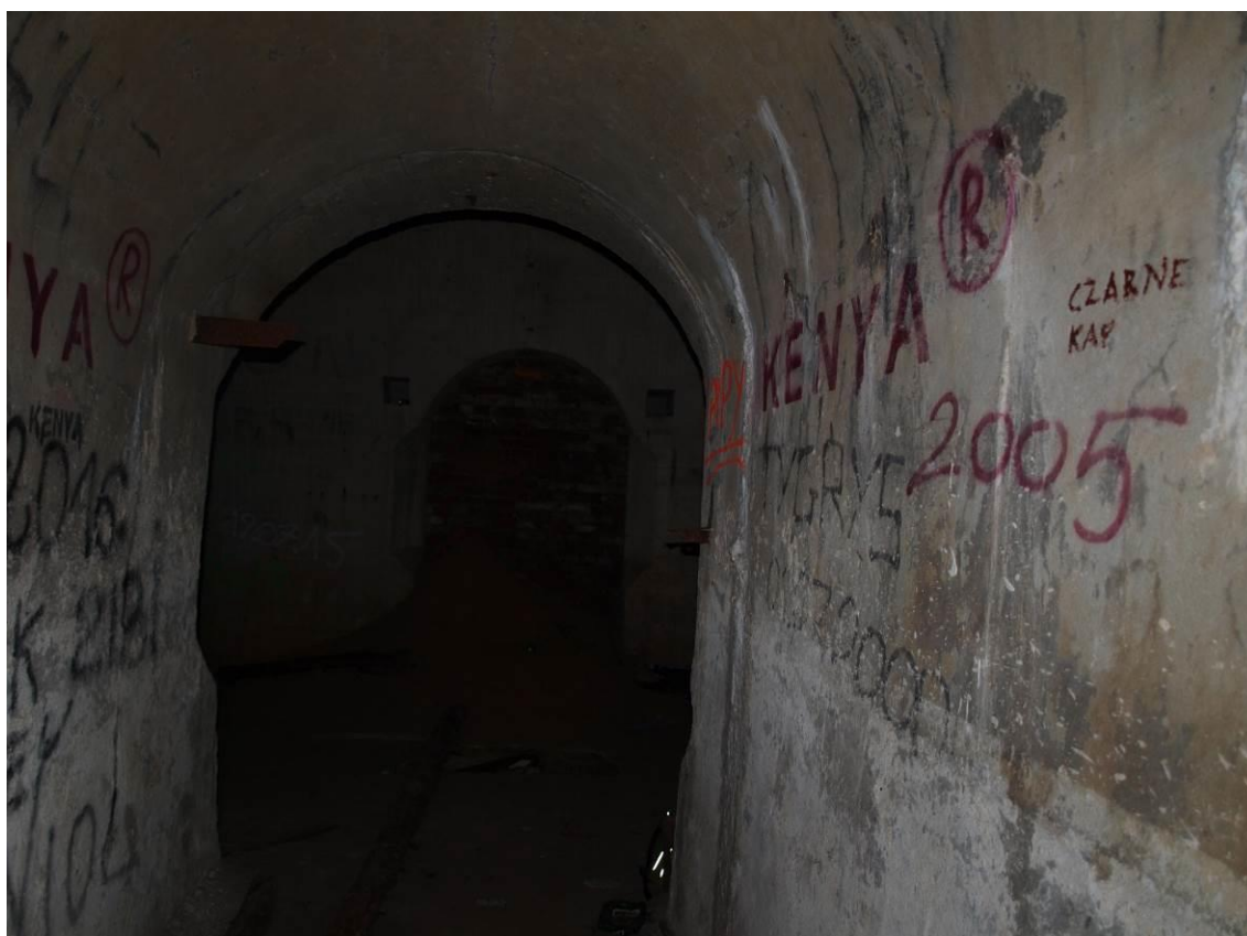
zdj. 5 – Widok na korytarz od strony szybu.